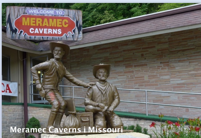
Meramec Caverns i Missouri

Langs Route 66 finner vi mange såkalte "roadside attractions". Noen er store, som f.eks. grottene Meramec Caverns i Missouri, og mange er mindre, som f.eks. flere "muffler men" vi finner langs ruten. Ofte er det spennende historier knyttet til attraksjonene som gjerne har stått der siden Route 66 var hovedferdselsåren. Alle har de ett formål, å få de veifarende til å stoppe. Mange attraksjoner er i full drift og tilbyr de veifarende omvisning og opplevelser, mens andre kun er en relikvie, et minne etter en forretning som en gang var i drift på stedet.