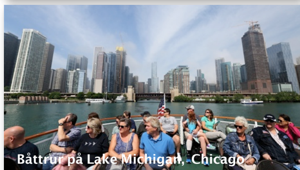
Båttrur på Lake Michigan, Chicago