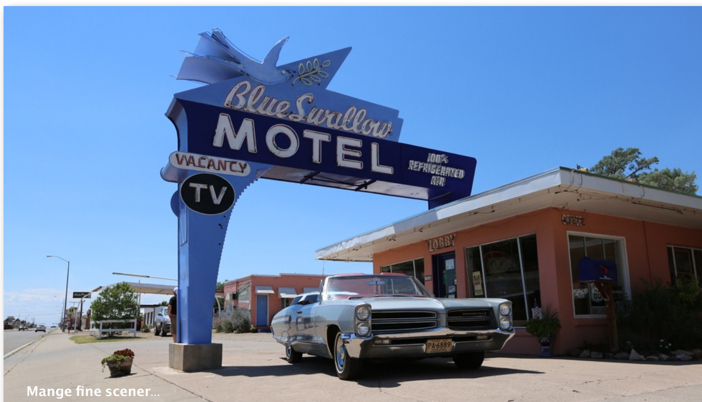
Mange fine scener...

Vi besøker Tucumcari, hvor klassiske neonskilt, kafeer og moteller fremdeles er intakte. Deretter Route 66-byen Santa Fe. Byen er helt ulik alle andre amerikanske byer, spesielt når det gjelder arkitektur. De som har lyst å bli med opp på fjellet Sandia Peak, som ligger høyt over Albuquerque, får med seg en fantastisk utsikt. Vi skal deretter til Flagstaff, hvor vi tar oss god tid til å rusle rundt i sentrum.