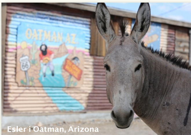
Esler i Oatman, Arizona

Route 66 har inspirert forfattere og låtskrivere mer enn noe annet stykke highway i Amerika. Entusiaster er med på å ta vare på veien og kulturen. Tusenvis av små forretninger langs ruten lever fremdeles av å selge varer og tjenester til oss veifarende.