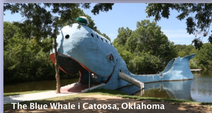
The Blue Whale i Catoosa, Oklahoma