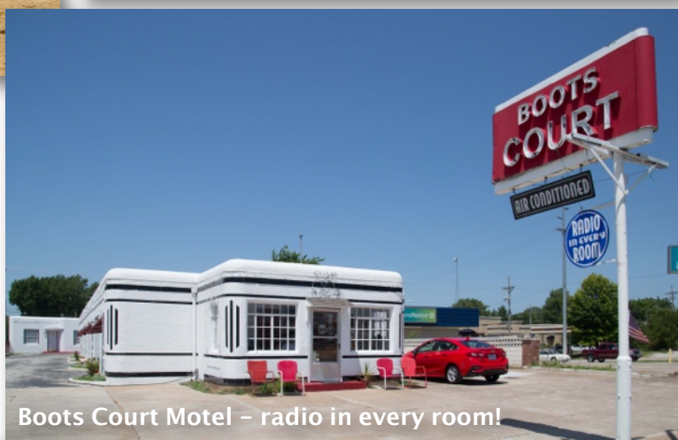
Boots Court Motel – radio in every room!

Vi kommer etter hvert til Texas med vide, åpne sletter og prærie. For de som vil, blir det mulighet for både hesteridning og Jeep-tur. Ruten går gjennom småbyer, blant longhorns, kveg og oljepumper. Småbyer som Shamrock og McLean passeres på veien mot vest. Vi overnatter i Amarillo og fortsetter videre mot New Mexico. Vi vil kjøre noen gamle, spennende traseer av Route 66, på grusvei og langt utenfor de vanlige traseer.