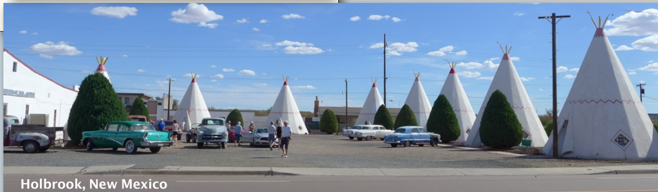
Holbrook, New Mexico

Mye av Route 66 er tofelts landevei som går innom tettsteder og småbyer, via hovedgaten og der folk bor. Vi finner små og store attraksjoner hele veien langs ruten. Noen ganger er det også verdt å ta en avstikker. Route 66 er skiltet, om enn noe varierende. Hjelp fra reiselederne, programheftet vårt, kart og GPS gjør det greit å finne frem. Vi kan kjøre nesten hele den gamle veien; kun noen ganske få strekninger må vi opp på Interstaten (motorveien). Noen strekninger kan de som vil, også kjøre grusvei – Dirt 66!