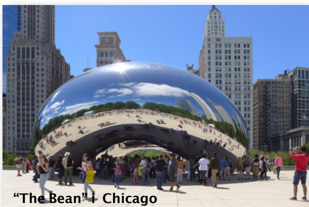
“The Bean” i Chicago

Vi ankommer Chicago den 20. juni og blir møtt av reiseleder på flyplassen. Vi har avsatt to netter i Chicago, og vi får med oss guidet tur til kjente Route 66-attraksjoner i byen, samt båttur på Chicago River og på Lake Michigan. I tillegg blir det tid til både restaurantbesøk og bluesklubb for de som ønsker.