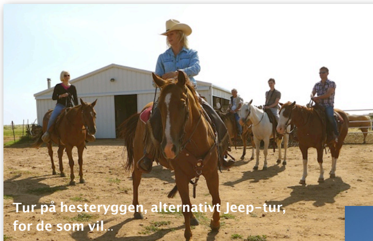
Tur på hesteryggen, alternativt Jeep-tur, for de som vil...