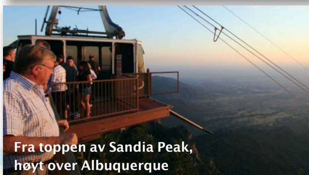
Fra toppen av Sandia Peak, høyt over Albuquerque