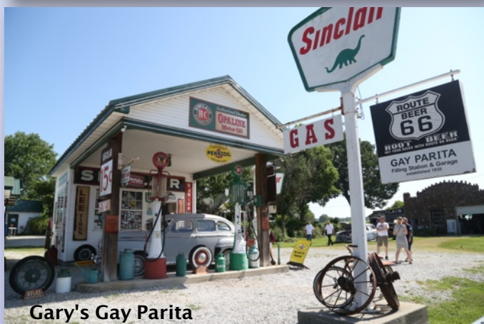
Gary's Gay Parita