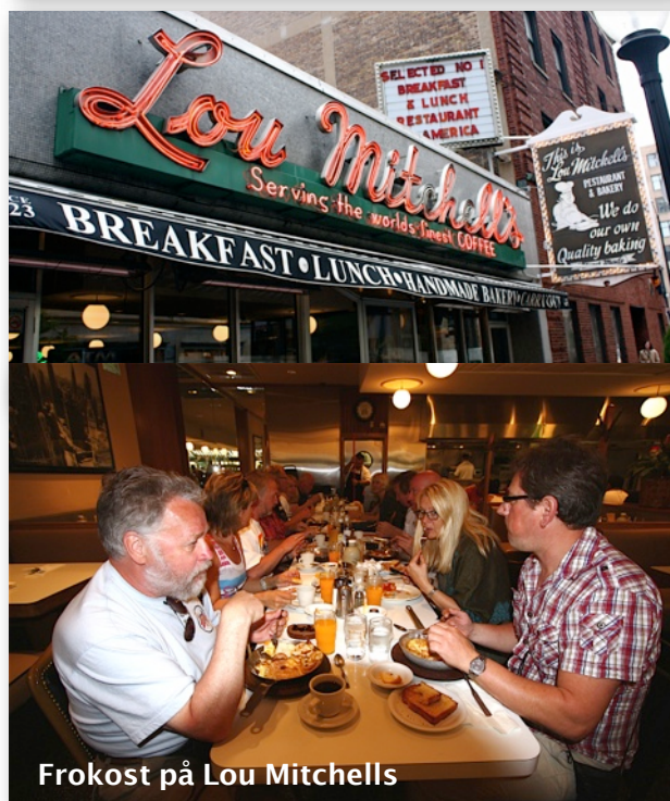
Frokost på Lou Mitchell's