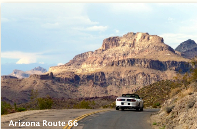
Arizona Route 66

Fra Kingman kjører vi siste etappe av Route 66. Vi kjører over fjellet mot Oatman, hvor eslene går løse i gatene. Deretter kommer vi til Golden Shores og Needles. Vi kjører innom Lake Havasu før siste etappe mot Santa Monica og Stillehavet. Vi avslutter med tre dager i Los Angeles-regionen.