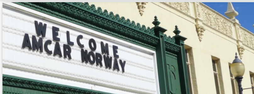
Mange steder ønsker oss velkommen langs veien.