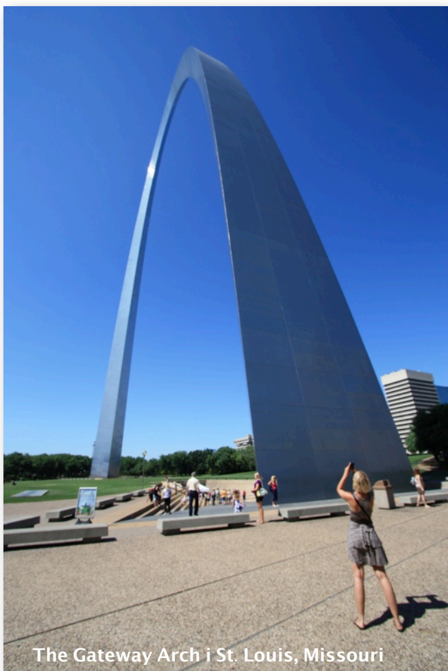
The Gateway Arch i St. Louis, Missouri

Når vi kommer til St. Louis, krysser vi mektige Mississippi River. Her kan det bli mulighet både for hjuldampertur på elven og besøk oppe i den 192 meter høye buen som er et landemerke i byen. I Missouri besøker vi hulen der Jessie James gjemte seg for lovens lange arm, og vi stopper også på flere bilattraksjoner.