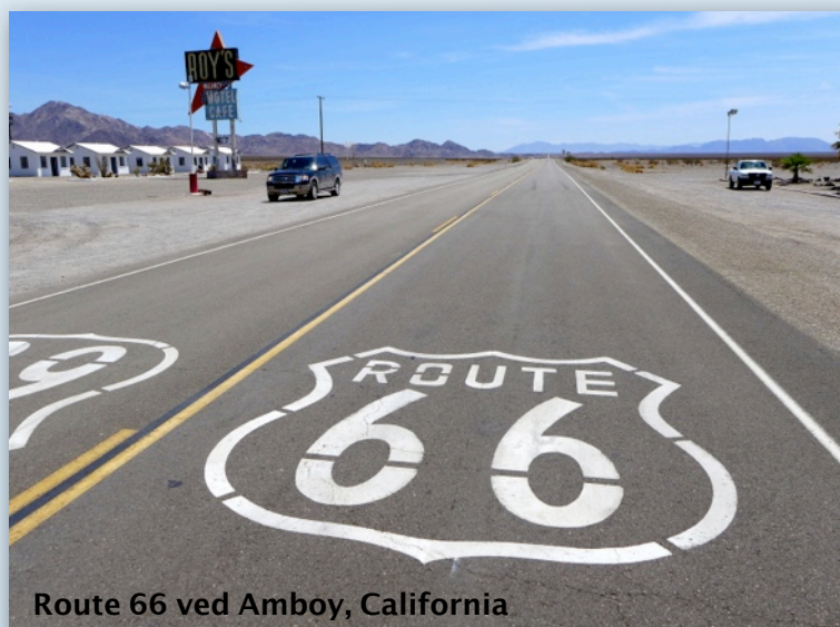
Route 66 ved Amboy, California