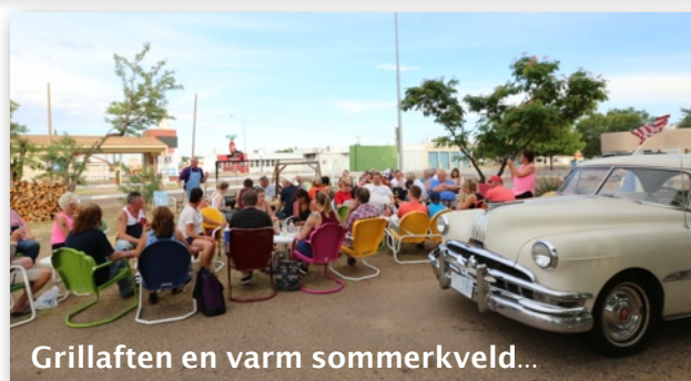
Grillaften en varm sommerkveld...

Vi gjør en liten avstikker fra Route 66 til storslagne Grand Canyon. Der besøker vi flere utkikkspunkter og får med oss en farvesprakende solnedgang om været er på vår side. Vi besøker Williams, Ash Fork, Seligman og Kingman. Deretter gjør vi en ny avstikker, denne gang til Las Vegas, hvor vi skal bo midt på den berømte Strip-en. Hoover Dam blir det også tid til å besøke.