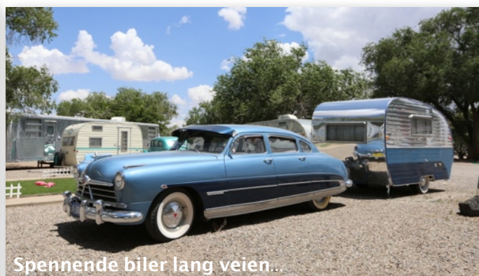
Spennende biler lang veien..