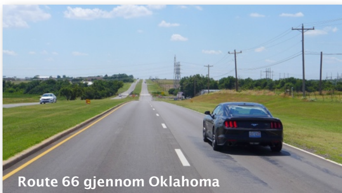
Route 66 gjennom Oklahoma

Vi sjekker ut bilene og forlater Chicago. Ferden går sørvestover gjennom staten Illinois. Langs veien gjør vi mange stopp ved små og store attraksjoner, både de du kan lese om i Route 66-bøker og noen bortgjemte "hemmeligheter" som få vet om.