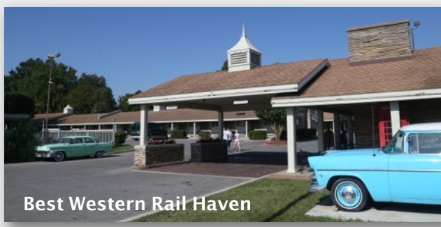
Best Western Rail Haven

Vi har valgt ut hoteller som holder fin standard, og som ligger sentralt på de steder vi besøker. Vi bruker kjedehoteller som Best Western, Marriott og Hilton, i tillegg til frittstående lokale hoteller. De fleste hotellrom har to dobbeltsenger. For par booker vi vanligvis én king size seng. Alle hotellene er inspisert av reiseleder i forkant. 95% av hotellene har basseng. En dukkert etter en varm dag gjør godt. Så å si alle hoteller er i gangavstand til restaurant.